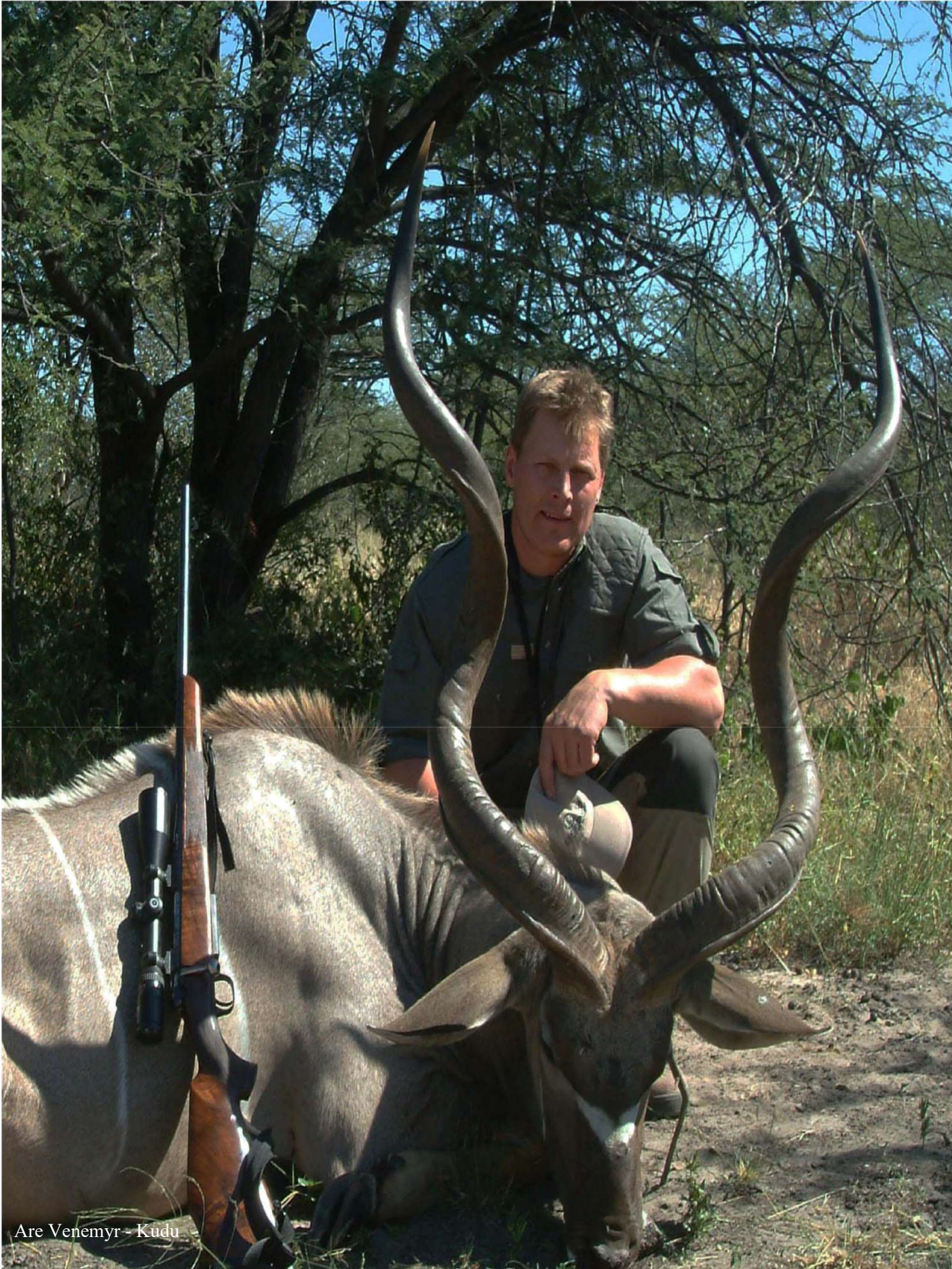
Are Venemyr - Kudu