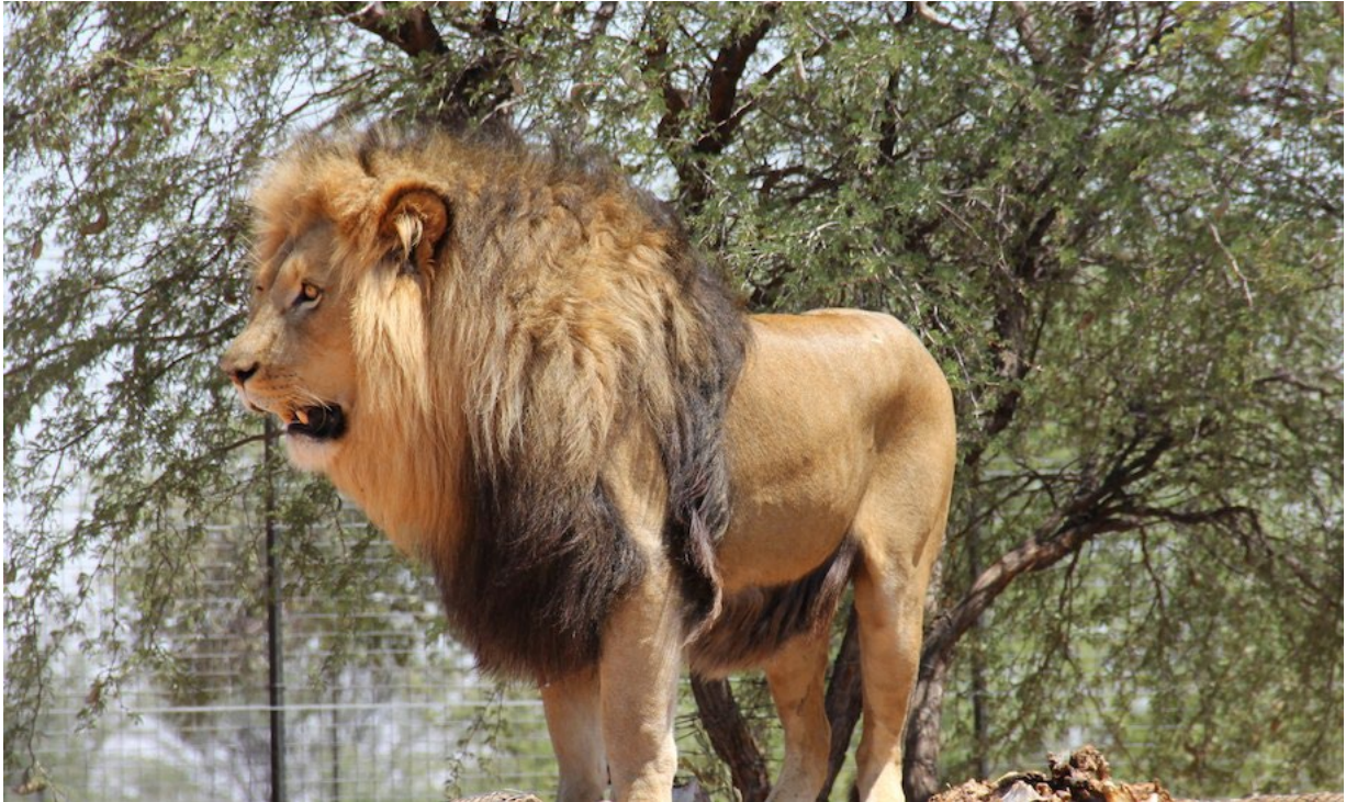
7 – 8 år gammel hannløve US 20000