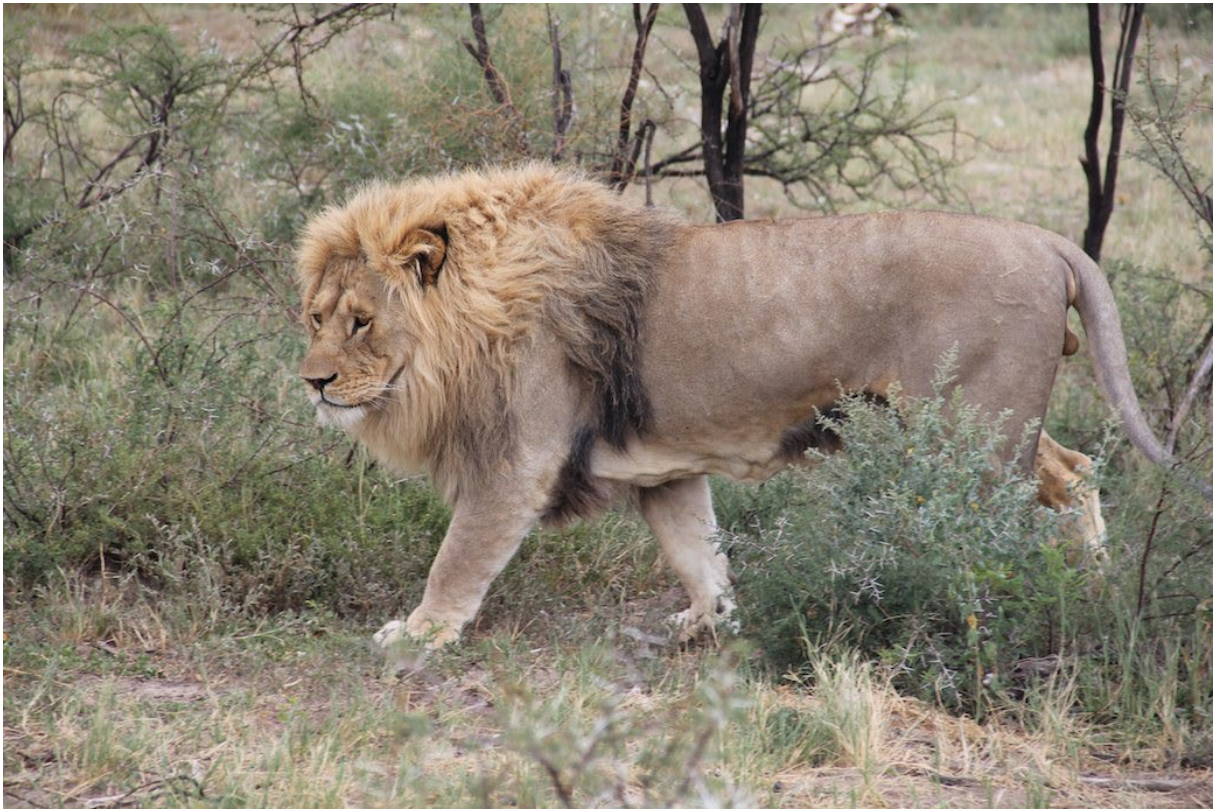
5-6 år gammel hannløve US14000